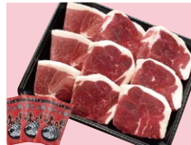
兵庫県【丹波篠山お>みや】 ポタン鍋 赤身肉セット