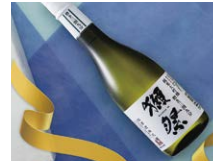
山口県 【旭酒造】獺祭