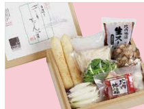
秋田県【佐田商店】 きりたんぼ鍋セット