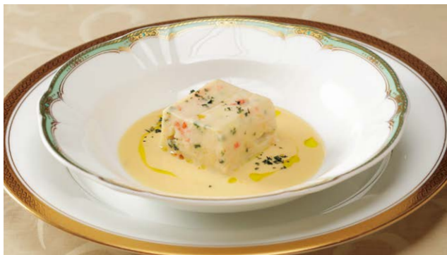
夢酒ダイニング「なかり」のメニューでもお楽しみいただけます(要予約)