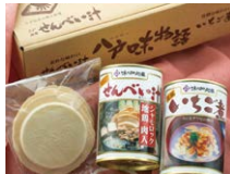
青森県【味の加久の屋】 いちご煮、せんべい汁セット

※当選者の発表は賞品の発送をもってかえさせていただきます。※写真はイメージです。