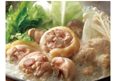
福岡県 【博多華味鳥】水たきセット