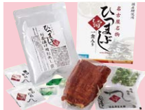
愛知県 【うなぎしら河】ひつまぶし