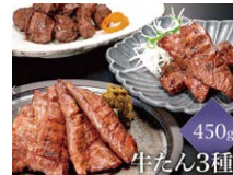
宮城県 【牛タン料理閣】牛タン