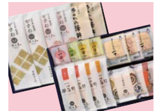
宮城県 【佐々直】笹かま