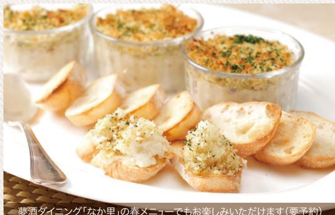
夢酒ダイニング「なか里」の春メニューでもお楽しみいただけます(要予約)