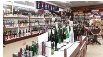
広い店内は酒とワインのミュージアム