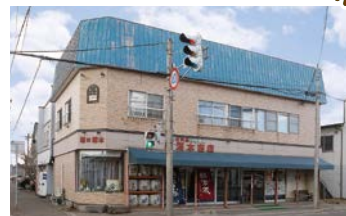
創業明治43年、老舗の風情を醸す本店の店構え

1本の吟醸酒との出会いから始まった全国蔵元巡り今や利き酒名人として全国に名を馳せる