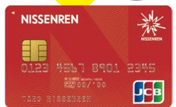
日専連JCBカード(新デザイン)