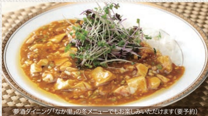
夢酒ダイニング「なかり」の冬メニューでもお楽しみいただけます(要予約)