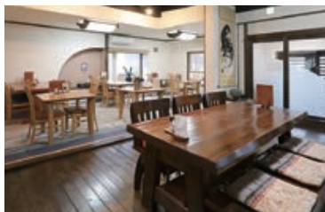
30席以上が用意される広々とした店内