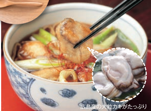
広島産の大粒カキがたっぷり