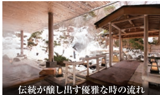
伝統が醸し出す優雅な時の流れ

美しく雄大な大自然の中に佇む 「登別の迎賓館」と称されてきた、 気品溢れる空間で、寛ぎのひととき をお過ごし下さい。