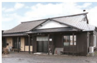
小さな丘の畑の中に佇む古民家

道央自動車道伊達インターを降りてすぐの信号を壮瞥町方面へ車を走らせると、約6kmほどで小さな丘の上に軒の古民家が佇む。周囲は畑と豊かな自然、ぼつりぼつりと農家が点在する農村地帯。ここに、手打ちそばと和食で評判の「里の茶屋」