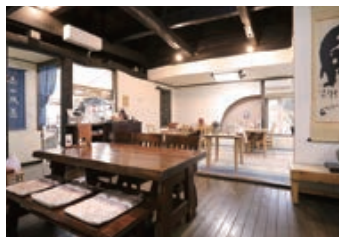
古の風情漂う落ち着いた店内