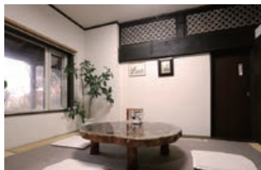
当時の武家屋敷の欄間をそのまま利用した個室