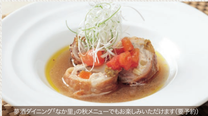
夢酒ダイニング「なかり」の秋メニューでもお楽しみいただけます(要予約)