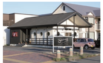
白い壁とテラスデッキが目をおしゃれな店舗