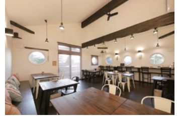
丸窓がかわいいゆったりとした店内