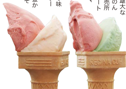
人気のジェラート(ダブル400円)季節により色々な味が楽しめます。