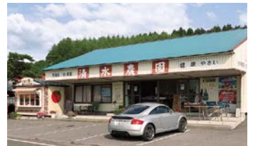
様々な種類のトマトやジェラートが楽しめます。