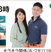
キラキラ関係(右:ワタリ119)