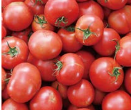
糖度別に仕分けられ箱詰めされます。