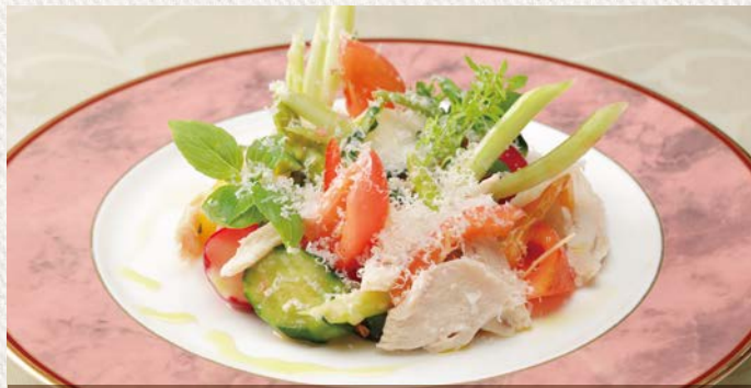
夢酒ダイニング「なか里」の夏メニューでもお楽しみいただけます(要予約)