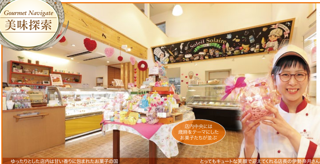
店内中央には 歳時をテーマにした お菓子たちが並び