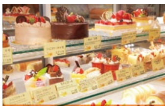
デコレーションケーキやショートケーキが並び