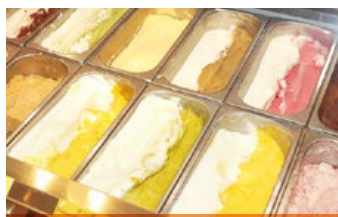
種類豊富な人気のジェラート

一度お菓子の国へお越しください。 まだ訪れたことがない方は、ぜひ ニューがゆっくりと楽しめる。 マカレーやロコモコなどのランチメ ニユーがゆっくりと楽しめる。 パンケーキ、オーブンサンド、パ フェなどのスイーツをはじめ、キ ーマカレーやロコモコなどのランチ メニューがゆっくりと楽しめる。 2Fにはカフェスペースが用意さ れており、こちらも大人気。 デコレーションケーキも15種類以 上用意されており、パーティーに欠 かせない。予約するとパースディ ケーキやウェディングケーキ、キ ャクターデコレーションなどの特注 のケーキも作ってくれます。