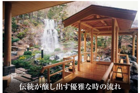
伝統が醸し出す優雅な時の流れ

美しく雄大な大自然の中に佇む登別グランドホテル。「登別の迎賓館」と称されてきた、気品溢れる空間で、寛ぎのひとつをお過ごし下さい。