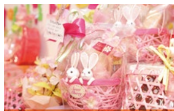
季節や歳時をテーマにしたかわいいお菓子たち