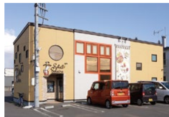
思わず目を引く、キュートな店構え

スイーツファンなら見逃せない お菓子に囲まれる至福の世界 お菓子ラボ「ソレイユソレイル」 は、苫小牧の有名洋菓子店「ファーム ソレイユ」の姉妹店として、2015 年7月に誕生。オリジナルのジェ ラートやロールケーキなどで人気 が沸騰、たちまち大人気の洋菓子店に。 一歩店内に踏み入ると、なんと 150種類を超えるケーキや洋菓 子が揃えられ、まるで絵本の中のお 菓子の国に迷い込んだよう。 季節や歳時などのイベントに合 わせた、とってもかわいいテーマ商 品も豊富に揃えられており、お土産 やお祝いにぴったり。さらに、新しい オリジナルスイーツも常に研究開発 されており、店内はわくわく感が いっぱい。まさにお菓子ラボ。 デコレーションケーキも15種類以 上用意されており、パーティーに欠 かせない。予約するとパースディ ケーキやウェディングケーキ、キ ャクターデコレーションなどの特注 のケーキも作ってくれます。