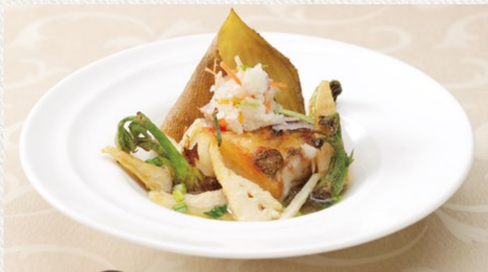
夢酒ダイニング「なか里」の春メニューでもお楽しみいただけます(要予約)