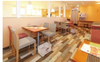
スイーツやお食事が楽しめる、2Fのカフェスペース