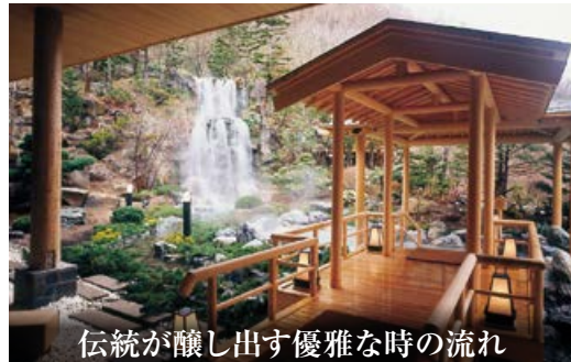
伝統が醸し出す優雅な時の流れ

美しく雄大な大自然の中に佇む「登別の迎賓館」と称されてきた、気品溢れる空間で、寛ぎのひとときをお過ごし下さい。