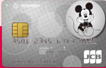
日専連JCBカード(ディズニー・デザイン)