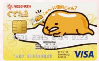
日専連VISAカード(くでたま・デザイン)

©2013, 2018 SANRIO CO., LTD. APPROVAL No.G582701 S/D-G