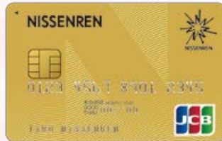
日専連JCBゴールドカード