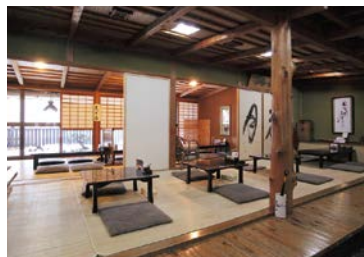
随所にこだわりと風格を醸す、落ち着いた店内。