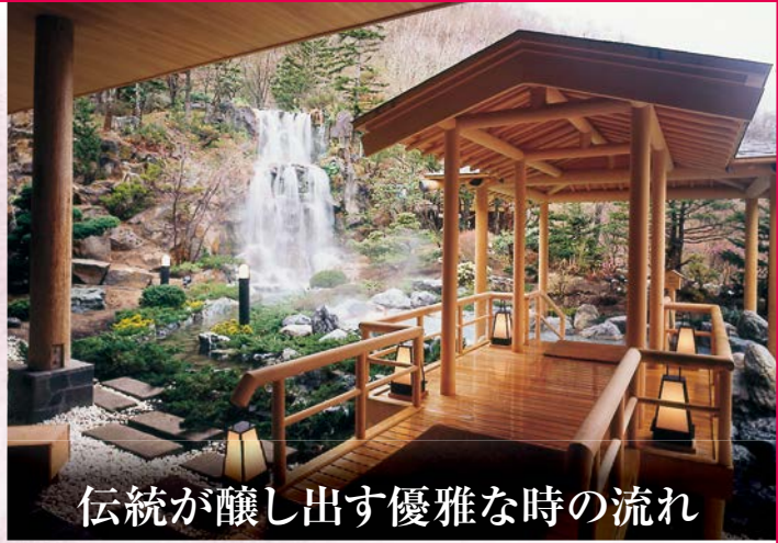
伝統が醸し出す優雅な時の流れ

1泊の宿泊代、夕食(バイキング)、朝食(バイキング)、サービス料・税金すべてコミコミ!! ビックリ価格! 7,980円/P~ (税込) 大人お一人様 平日泊 3~5名様1室(和室)の場合