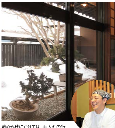
春から秋にかけては、手入れの行き届いたきれいな庭が店内から楽しめます。