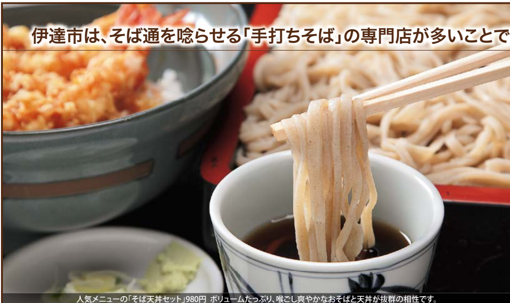
人気メニューの「そば天丼セット」980円 ポリウムたっぷり、喉ごし爽やかなおそばと天丼が抜群の相性です。