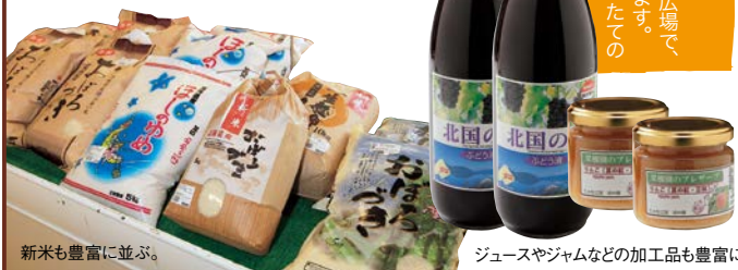
新米も豊富に並び、ジュースやジャムなどの加工品も豊富に。

《収穫祭があります》 10月23日(日)にはサムズの広場で「サムズ収穫祭」が開催されます。地元の各農家の方々かとれたての農産物を持ち寄って出店します。