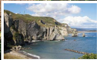
①トッカリシヨ(トッカリシヨ展望台)