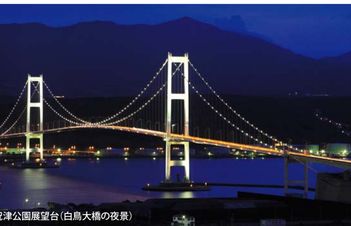
●祝津公園展望台(白鳥大橋の夜景)