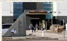
●道の駅みたら室蘭 (白鳥大橋記念館)