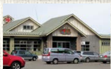
●室蘭温泉 ゆらら (露天風呂からの夕陽が最高)