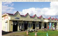
●屋台村(室蘭やきとり、 カレーラーメンなど)