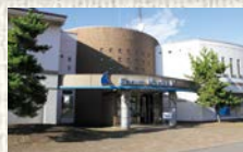
●エンルムマリーナ (ボート、釣りファンならココ)