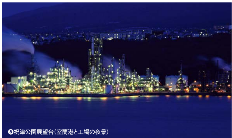
●祝津公園展望台(室蘭港と工場の夜景)