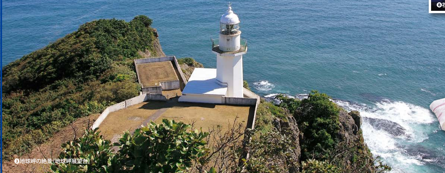
③地球岬の絶景(地球岬展望台)

クジラとイルカに逢える街、大自然が織りなす景勝地、そして新鮮な魚介類、2大B級グルメなど、室蘭は楽しい感動で溢れている街。あらためて実感してみませんか? こんな身近なところに、こんなに感動があるなんて。この秋は室蘭の再発見、探索ドライブへGO!