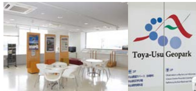
2Fの火山防災学習館。有珠山、昭和新山を一望できます。

穫れたてのフルーツと野菜、お米で大人気。秋には店内が甘い香りでいっぱいにあふれる。