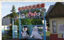
●むろらん水族館 (北海道初の水族館)