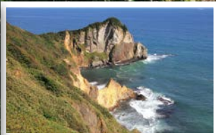
②金屏風(金屏風展望台)