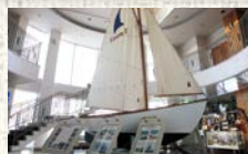
●エンルムマリーナ館内 (母恋めしが買えます)