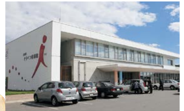
壮警町の情報発信基地「そうべつ情報館i(アイ)」