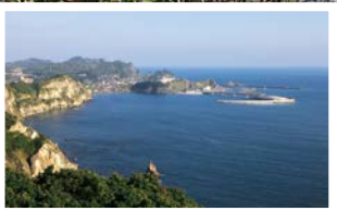
④マスイチ展望台(マスイチ浜)