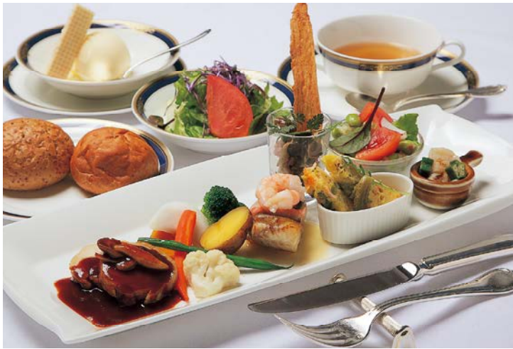
人気のランチセット / 週替わりおすすめワンプレートランチ(スープ、ライス、サラダ、ミニアイス付き) 1,400円

スカイレストラン&バー「グランビュウ」は、苦小牧のランドマーク「グランドホテルニュー王子」16階にある。美しい苦小牧の街並みの眺望と道産素材を駆使した、本格フレンチやイタリアンを楽しむことが出来る洋食レストランだ。大切なお客様のおもてなしやご家族の特別の日、そしてとっておきのデートスポットとして人気を集める。 しかし、1階のレストランには良く足を運ぶが16階までは減多に行かないという人も多い。