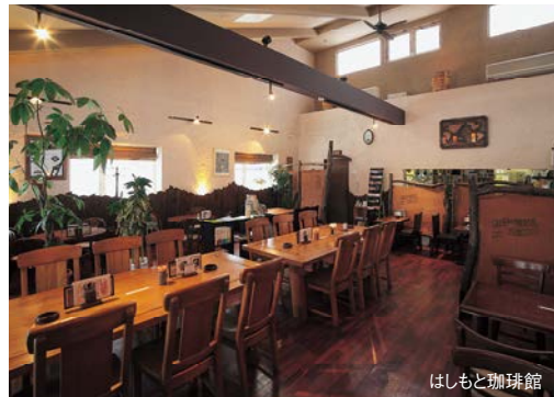
珈琲色の深い味わいを醸すシックな店内。器はすべて陶芸館で作られた物。