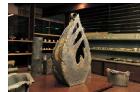
ギャラリーでは多数の器を展示。