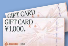
日専連ギフトカード 1,000円券

※日専連ギフトカードの500円券につきましては、平成22年2月28日(日)をもちまして、販売終了とさせていただきます。