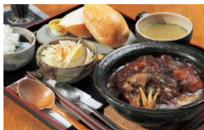
人気の白老牛煮込みハンバーグ1,200円