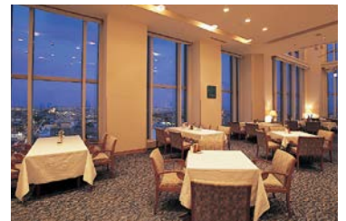
グランビュウ店内 / 苦小牧市内の眺望と上質な空間

スカイレストラン&バー「グランビュウ」は、苦小牧のランドマーク「グランドホテルニュー王子」16階にある。美しい苦小牧の街並みの眺望と道産素材を駆使した、本格フレンチやイタリアンを楽しむことが出来る洋食レストランだ。大切なお客様のおもてなしやご家族の特別の日、そしてとっておきのデートスポットとして人気を集める。 しかし、1階のレストランには良く足を運ぶが16階までは減多に行かないという人も多い。