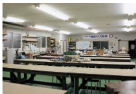
体験工房/あなたも是非一度。