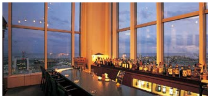
バーコーナー / 美しい苦小牧市内が一望でき、幸せな気分に。