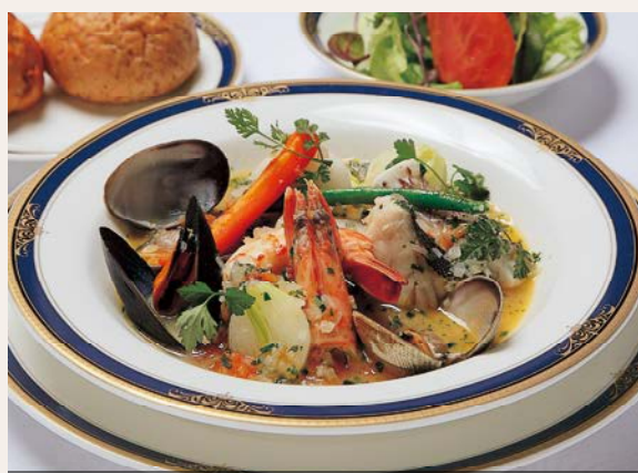
(料理協力/グランドホテルニュー王子、グランビユー)

日本料理という海鮮鍋だと思ってください。 魚介類が多ければ多いほど旨みが出ます。但し、長時間煮込んでしまうと旨みが臭みになりやすいので、あまり煮すぎず、魚介類や野菜を取り出してから煮詰めるのがポイント。 香草類はお好みによって自由に合わせてください。