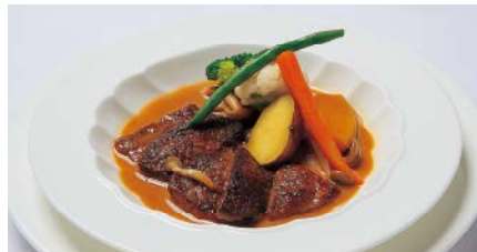
地元食材を使った人気メニュー / 植苗牛のストロガノフ 1,600円

そんな方のために、もつと気軽に洋食を楽しんでいただきたいと、用意しているのがお手軽なランチだ。リーズナブルなおいしい料理と美しい眺望を楽しむことが出来る。 ちょっと贅沢な気分でランチを楽しんでもお財布には優しいのがとっても嬉しい。 ディナータイムには、グランドメニューをはじめ150種以上のワインが用意される。パークコーナーもオープンし、美しい夜景を眺めながらお酒を愉しむことが出来る。こんな素敵な場所で想いを告白したら、きっと恋も……。